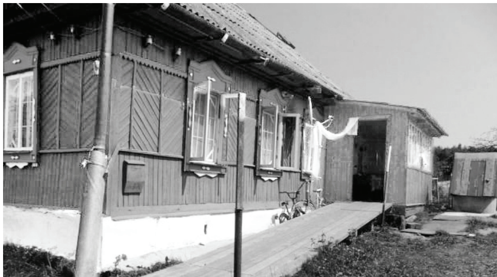
Домик радости и счастья.